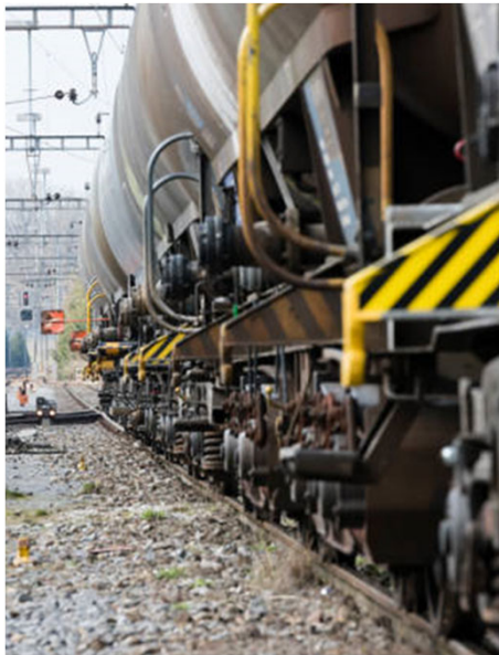
Godstransport med tog